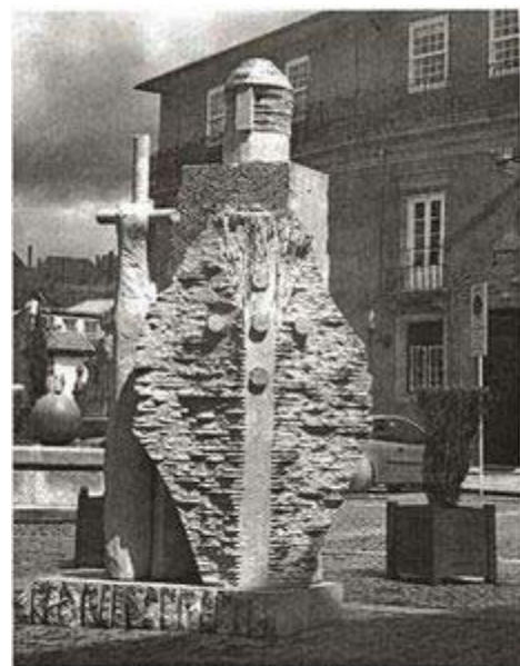
No Largo João Franco

«A cidade de Guimarães resolveu e muito bem prestar homenagem e perpetuar a memória do rei fundador da nacionalidade, que aqui terá nascido e passado parte da sua vida, através de dois monumentos distintos, de épocas distintas.