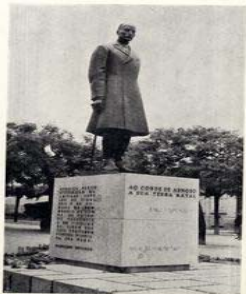
Estátua do CONDE DE ARNOSO, inaugurada em Guimarães, no Largo da República do Brasil, em 29 de Abril de 1961.

©Escultor Joaquim Correia, Arquitecto Augusto Mendes.